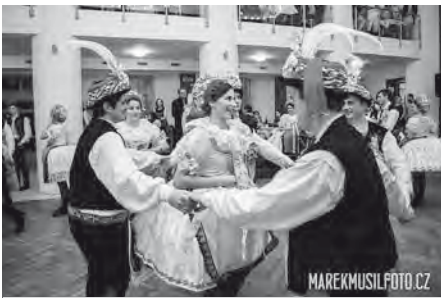
Chasa zatančila na Krojovaném plesu roku 2016 Českou besedu.

V souladu s tradicí zahájil i letos plesovou sezónu ve Velkých Pavlovicích Krojovaný ples. Stalo se tak v sobotu podvečer dne 9. ledna 2016. Již dlouho před začátkem se sál plnil návštěvníky, kteří se přišli nejen pokochat krásou velkopavlovického kroje, podívat se na vystoupení folklórního souboru Sadováček pod vedením paní učitelky mateřské školy, na Českou besedu v podání místní chasy, ale především si zatančit s dechovou hudbou Sokolka.