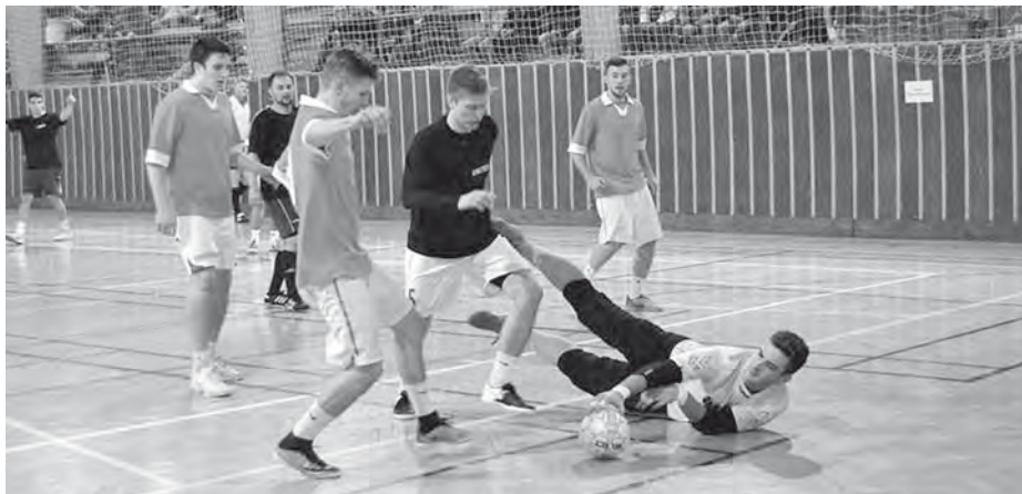
Druhý svátek vánoční opět ve znamení kopané. Štěpánský turnaj si užil v roce 2015 slávu comebacku.