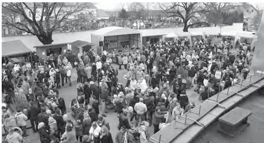
Velkopavlovický Jarmark u radnice je stále populárnější. Najde se jen hrstka těch, kteří si jej nechají ujít.