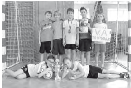
Vítězný tým mladší kategorie turnaje O pohár starosty města v sálové kopané - třída 5.A.

lepších týmech se rozhodovalo v téměř tříhodinovém klání. V mnohých družstvech nastoupily po boku chlapců také dívky, čímž ukázaly, že se tohoto sportu nebojí ani ony. Vítězný pohár si odnesl tým 3.A třídy a ve starší kategorii slavili prvenství hráči z 5.A.