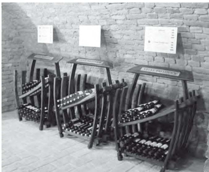
Expozice vín Modrých Hor otevřena...