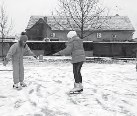
Bílá ledová a sněhová nadílka, u nás pohled veskrze vzácný.