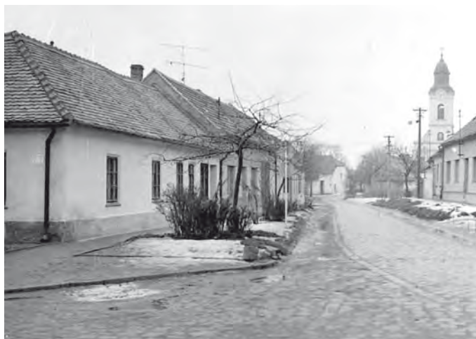
Pohled z ulice Bezručova směrem ke kostelu (snímáno z křižovatky u prodejny potravin).