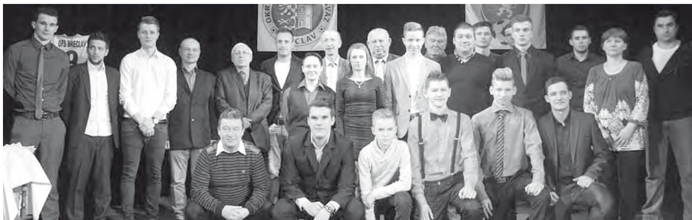
Předávání cen ankety Fotbalista roku 2015 v na prknech divadla v Boleradicích.

Už podesáté se do bo leradického divadla v sobotu dne 23. ledna 2016 sjela fotbalová smetánka z celého Břeclavska v rámci vyhlášení a předávání cen ankety Fotbalista roku 2015. Je velmi potěšující, že ani letos