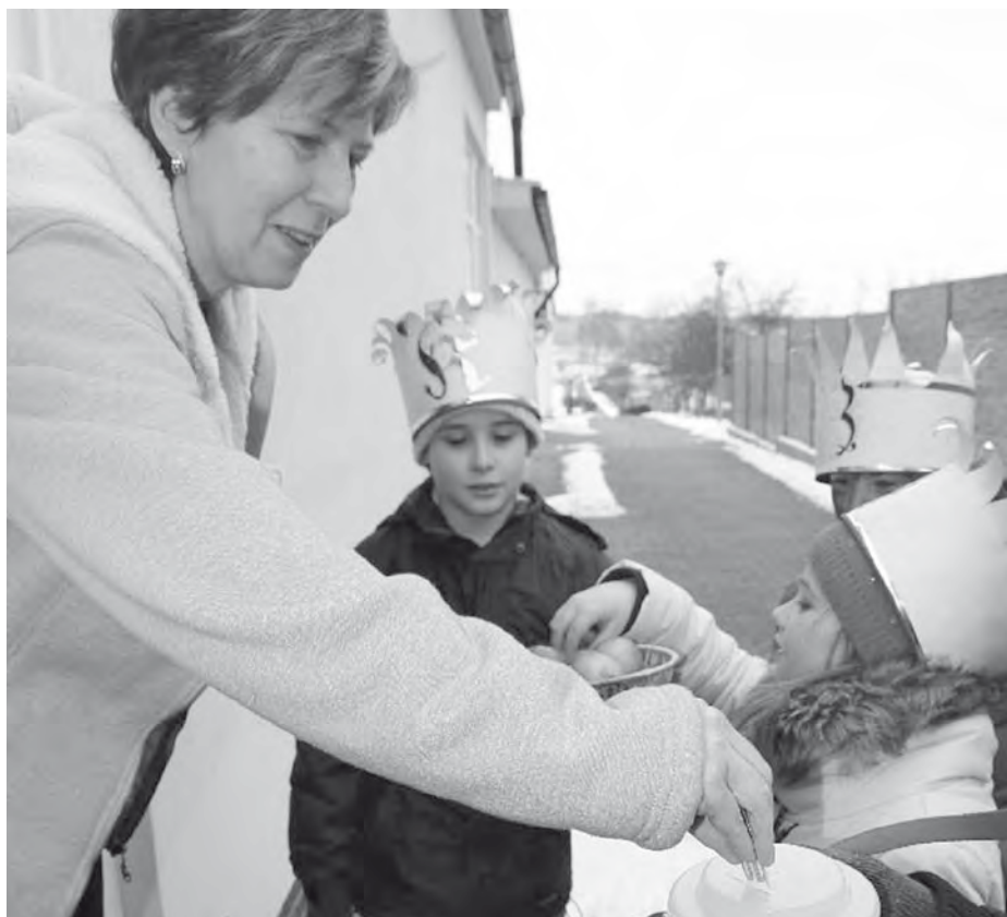
Každá korunka se počítá! Letos jich velkopavlovičtí do kasiček Charity České republiky nasypali neuvěřitelných 82.847! Zasloužíte si obdiv a poděkování!