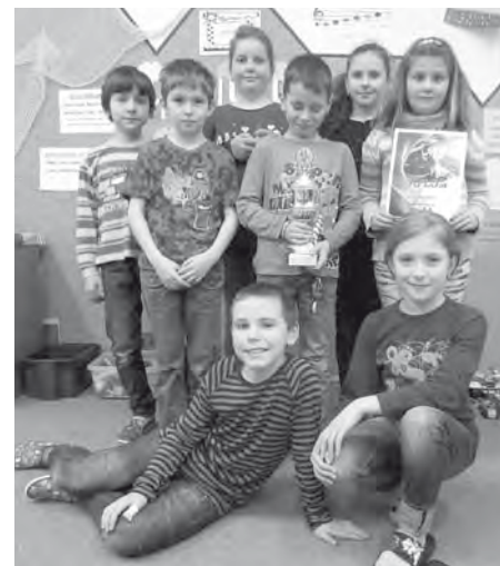
Vítězný tým starší kategorie turnaje O pohár starosty města v sálové kopané - třída 3.A.

jejich výkony moc chválíme a těšíme se na ně v příštím školním roce.