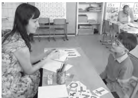
První velký krok vstříc školnímu vzdělávání – zápis dětí do 1. třídy.