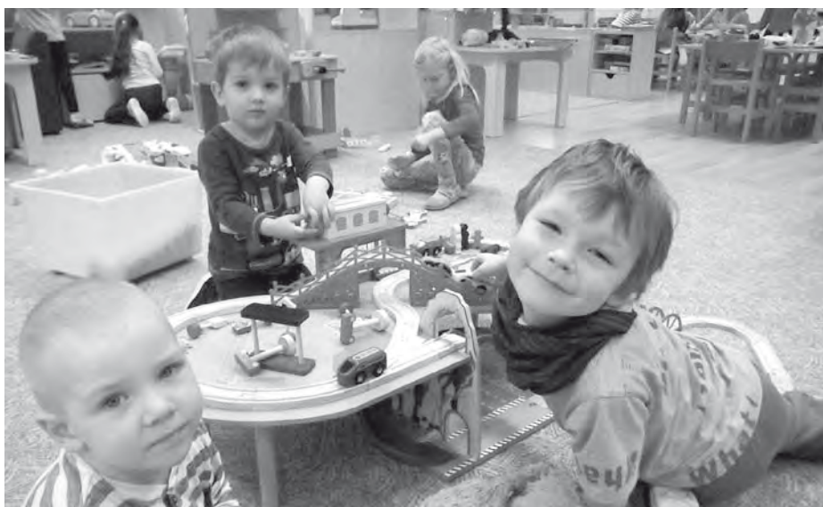
Školka? Ráj na zemi... u nás na ulici V Sadech :-).