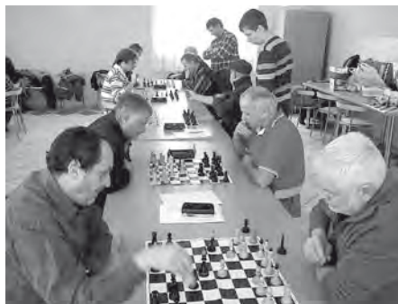
Tiché soustředění nad čtyřiašedesáti černobílými poli, toť šachy, hra hodná králů.

Konec roku je časem bilancování a my s hrdoostí můžeme konstatovat, že se nám opět začíná dařit. V okresní soutěži máme