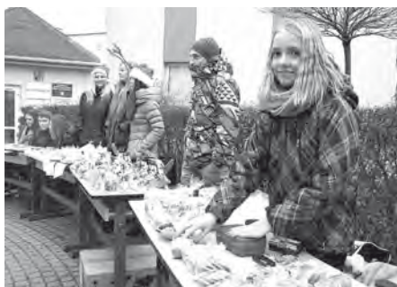
Studenti se snažili, seč jim síly stačily a to nejen zboží připravit, ale hlavně prodat, pro dobrou věc.

Díky Erice, která minulý rok odmaturovala, začal před lety studentský parlament připravovat jarmark, po kterém následoval vánoční koncert v kostele při-