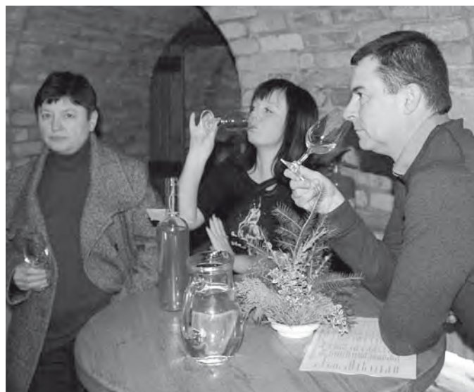
vítá své první návštěvníky.

Dne 9. prosince 2015 byla ve Vinných sklepech Františka Lotrinského ve Velkých Pavlovicích slavnostně otevřena stálá prodejní expozice vítězných vín, která získala ocenění TOP 30 vín Modrých Hor ve stejnojmenné soutěži.