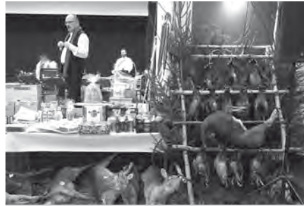
Zvěřinová tombola, velké lákadlo pro návštěvníky Mysliveckého plesu.