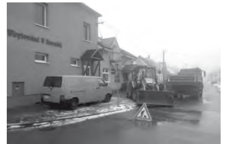
Havárie vodovodního řádu na ulici Ořečková, před prodejnou Vinařské potřeby Bureš.

Mrzlo, až praštělo... O víkendu ve dnech 23. a 24. ledna 2016 ve Velkých Pavlovicích spíše praskalo a to potrubí vodovodního řádu. Na čas si tak museli ukrojit ze svého pohodlí a komfortu jindy tekoucí vody z kohoutku v ulicích Ořečková, Kopečky a Pod Břehy. Rychlou a kvalitní práci odvedli zaměstnanci pohotovostní složky firmy VaK, a.s. Břeclav, závady neprodleně odstranili a sjednali nápravu.