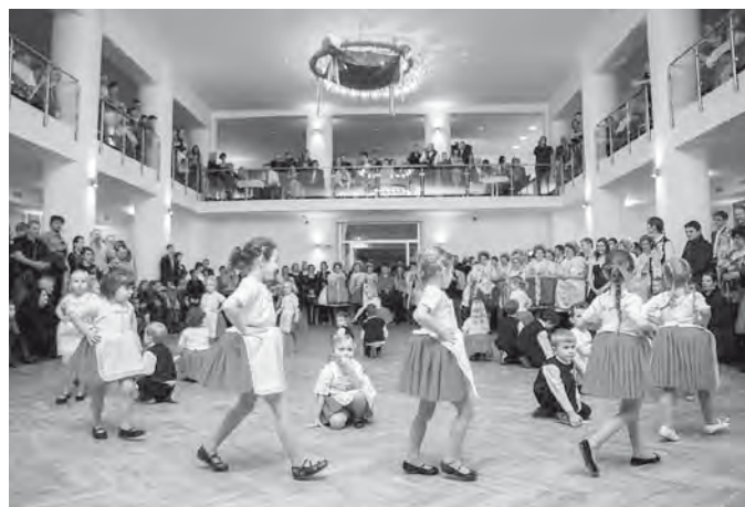
Na Krojovaném plese si děti užily nejen radosti z tance, ale i zasluženého potlesku. Vystoupení se jim podařilo na jedničku s hvězdičkou.