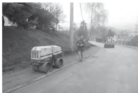
Ulice Pod Břehy – budování nových podélných parkovacích ploch.

Ulice V Údolí patřila v minulosti dlouhodobě k obtížněji průjezdným. To se však během prosince 2015 změnilo. Služby města Velké Pavlovice zde vybudovaly podélná odstavná stání pro osobní automobily, které zde do té doby parkovaly na okraji silnice a velmi často způsobovaly doslova zácpy. Z důvodu vybudování odstavných stání bylo třeba náročného kroku a to odbagrování části břehu. Poté byl na tyto plochy položen zpevňující povrch z betonového recyklátu.