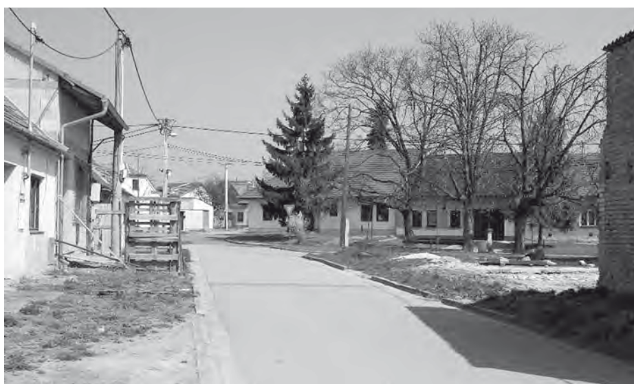
Pohled na křižení ulic Čechova a Bezručova (snímáno z ulice Čechova cca od domu rodiny Hiclový).