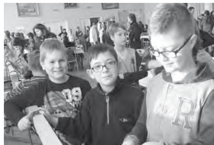
Přestože sbírali první zkušenosti, v Bořeticích se mladí hasiči nezasukovali!

Mladí hasiči se v sobotu 16. ledna 2016 zúčastnili uzlovací štafety v sousedních Bořeticích. Cílem nebylo ani tak útočit na stupně vítězů, ale spíše nabrat zkušenosti do dalších štafet. Naše hasičská omladina