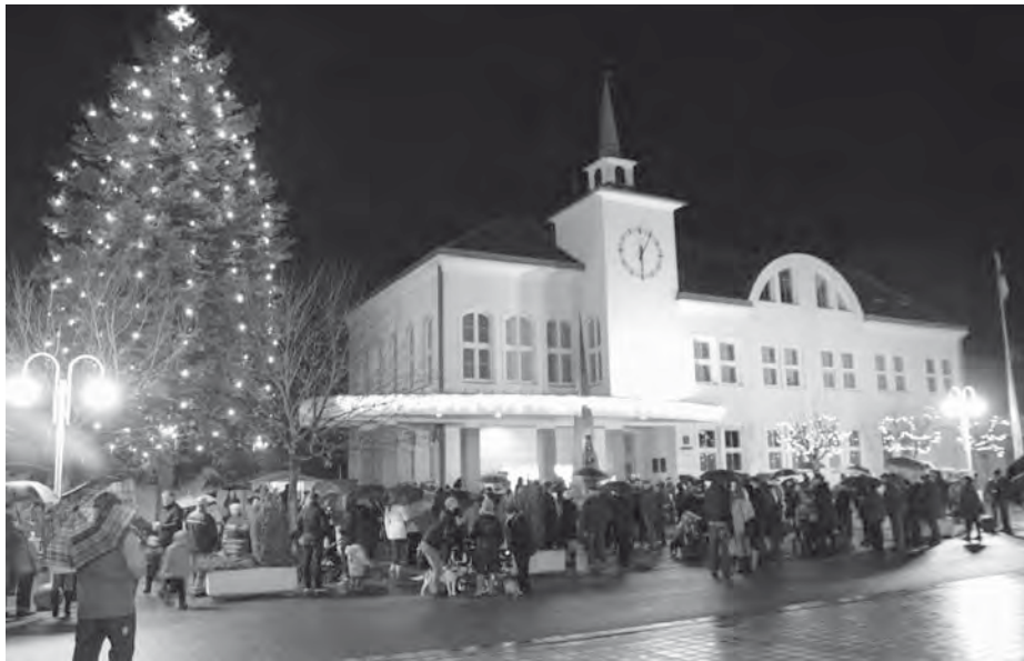
Velkopavlovičtí zpívají koledy s celým Českem, zároveň se kochají pohledem na novou světelnou výzdobu vánočního stromu u radnice. Advent s těšením na kouzelné svátky Vánoc začíná...

Velké Pavlovice se díky odhadem stopadesáti našich aktivních občanů, kterým ani déšť nezhatil plány vyrazit do studených ulic města, staly součástí ohromného pěveckého chóru. Byl to krásný pocit uvědomit si, že třeba tam a tam, i stovky kilometrů