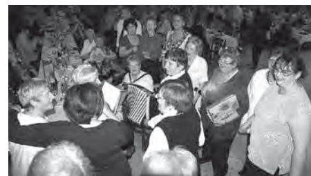
Mikulášský večírek u slovenských sousedů si seničtí i velkopavlovičtí senioři skvěle užili. Zpěvu a tance se nemohli nabažít, od harmoniky se pomalu kouřilo!