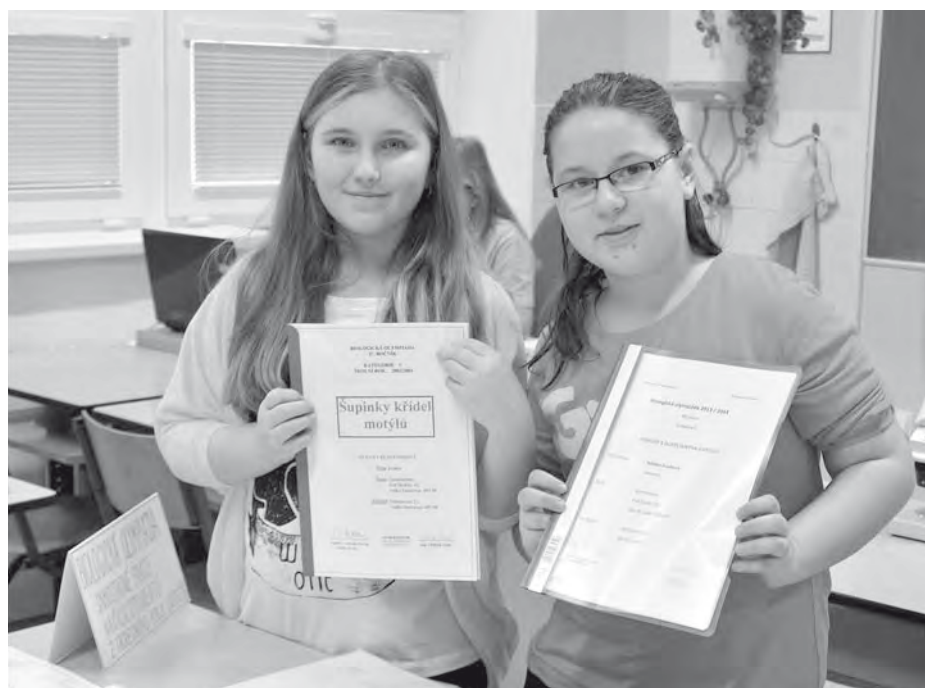
Svou školu se zájmem a hrdostí propagují i letošní nováčci, studentky třídy prima.