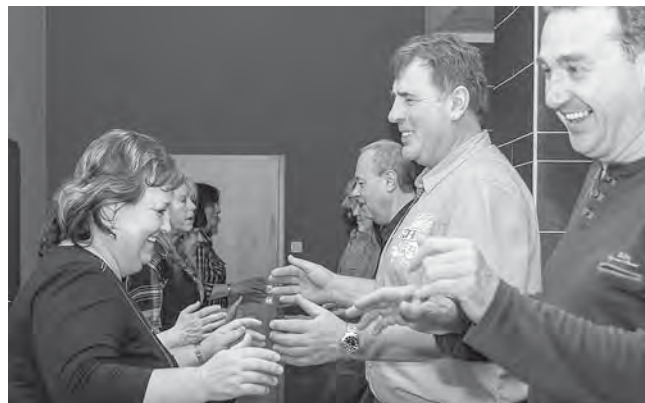
Závěr výroční schůze Přátel country patřil jak jinak než společnému tanci!

A jak jsme zakončili oficiální část této "výroční schůze" taneční skupiny? No přece tancem! Veselo bylo dlouho přes půlnoc, tak jak to mezi dobrými přáteli