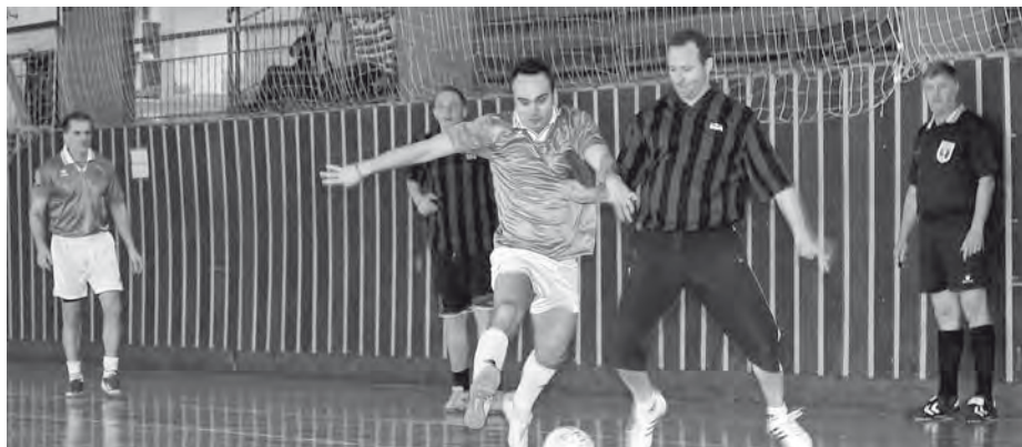
Do bojů o modrohorský pohár dali hráči očividně naprosto vše!